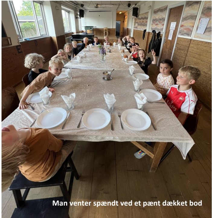
Man venter spændt ved et pænt dækket bord