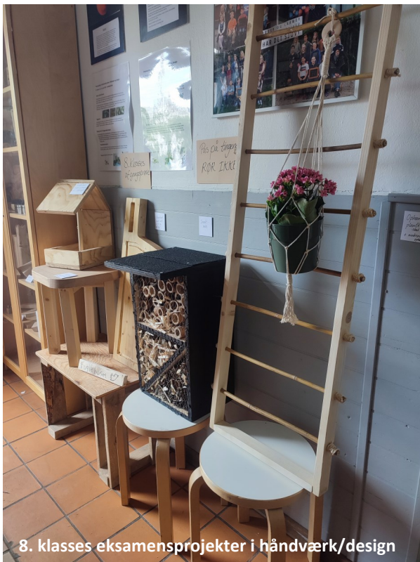
8. klasses eksamensprojekter i håndværk/design