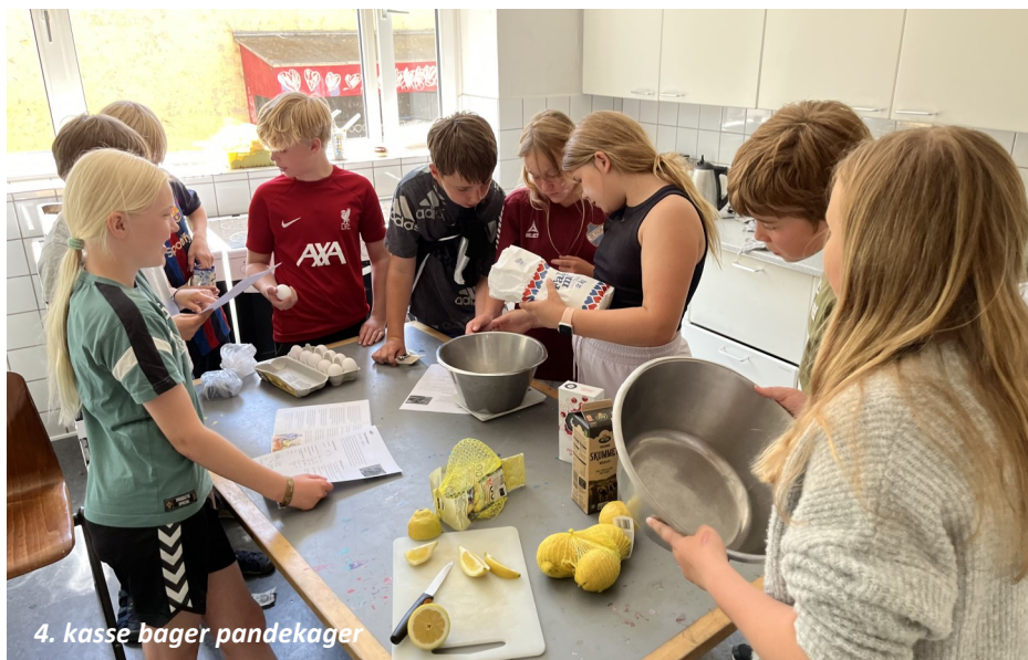
4. klasse bager pandekager

SFO'en er åben fra kl. 6.45 til 17.00 hver dag. Nye elever optages på skolen, såfremt der er plads på det pågældende klassetrin. Vi har til huse i en fritliggende bygning i grønne omgivelser. Inden for disse rammer har vi en velfungerende arbejdsplads, for både lærere og elever, hvor alle kender alle.