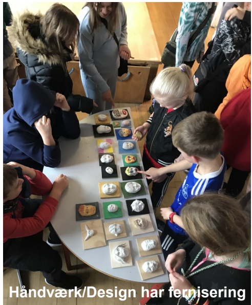
Håndværk/Design har fernisering

Loven om gratis skoletandpleje gælder også for privatskoler. Skolen indsender i september en liste over eleverne til de respektive kommuner, som så i løbet af året indkalder eleverne til tandeftersyn.