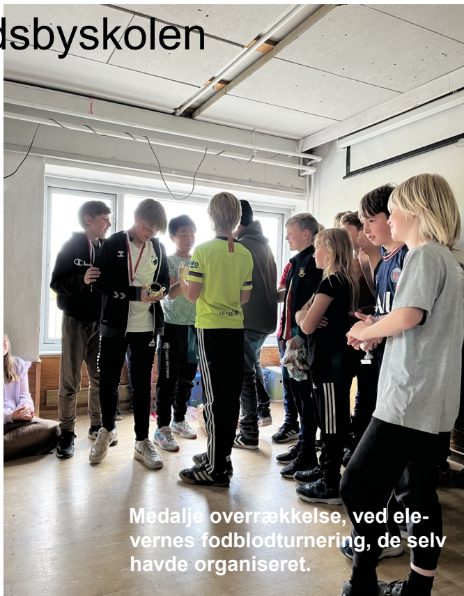
Medalje overrækkelse, ved elevernes fodboldturnering, de selv havde organiseret.

SFO'en er åben fra kl. 6.45 til 17.00 hver dag. Nye elever optages på skolen, såfremt der er plads på det pågældende klassetrin. Skolen har til huse i en fritliggende bygning i grønne omgivelser. Inden for disse rammer har vi en velfungerende arbejdsplads for både lærere og elever, hvor alle kender alle.