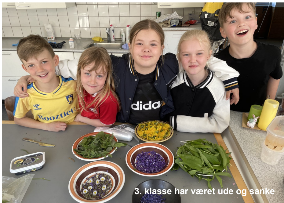
3. klasse har været ude og sanke

Vi lægger stor vægt på samarbejde, både kollegialt og med elever og forældre. Vi er engagerede i elevernes faglige, menneskelige og sociale udvikling. Vi anerkender og forventer, at forældrene tager ansvar for opdragelsen, men vi støtter naturligvis. Vi forventer af eleverne, at de er villige til at opfylde de faglige krav, skolen stiller, og at de har en åben og venlig optræden. Det er en klar forudsætning, at eleven gør sit bedste. Klasselæreren er ansvarlig for den løbende forældrekontakt og er primus-motor i teamsamarbejdet om den enkelte klasse/elev. Vi holder typisk et forældremøde og to skole-hjem samtaler om året, hvor eleven og forældrene sammen får lejlighed til at møde klassens lærere og få en vurdering af, hvordan eleven klarer sig fagligt og socialt. Hvis der i perioder er behov for ekstra opmærksomhed omkring en elev, bruger vi gerne tid på samtaler med hjemmet. I tilrettelæggelsen af undervisningen tager vi udgangspunkt i den enkelte elev/klasse, så alle elever kan få mulighed for at udnytte deres evner. Vi benytter et samspil mellem klasse- og individuel undervisning. Dette indebærer, at elever i samme klasse ikke nødvendigvis altid arbejder med det samme materiale.