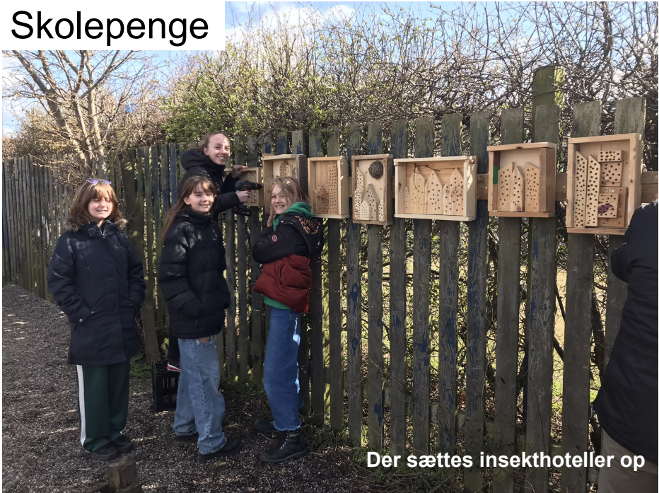
Der sættes insekthoteller op

Skolepenge for skoleåret 22/23 er kr. 1450,- per måned i 12 måneder fra august til og med juli. Der ydes søskenderabat på kr. 300,- per måned til forældre med flere børn gående på skolen.