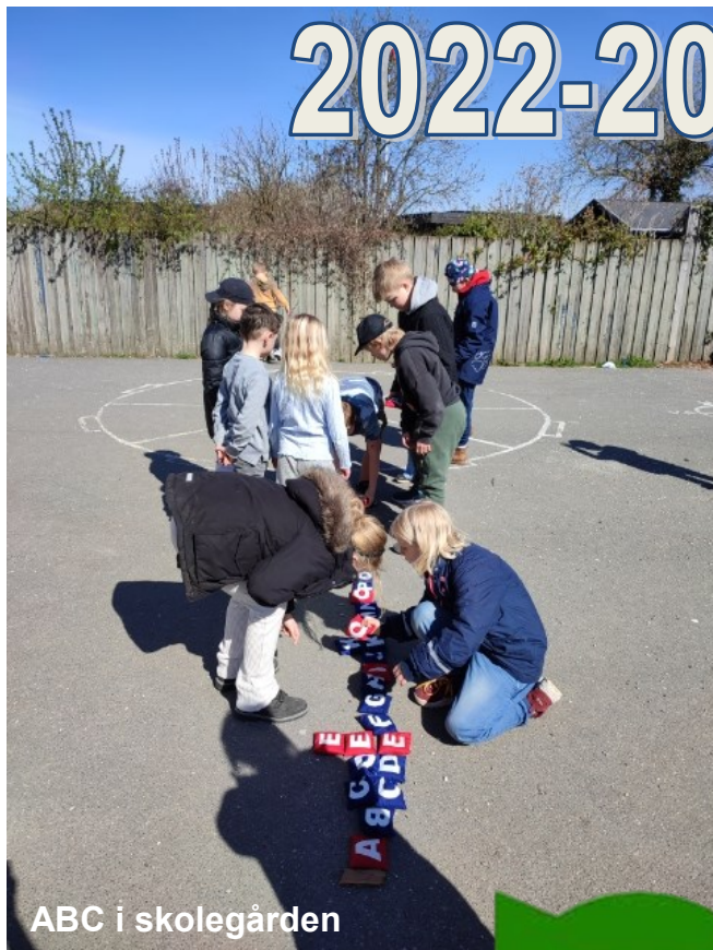
ABC i skolegården