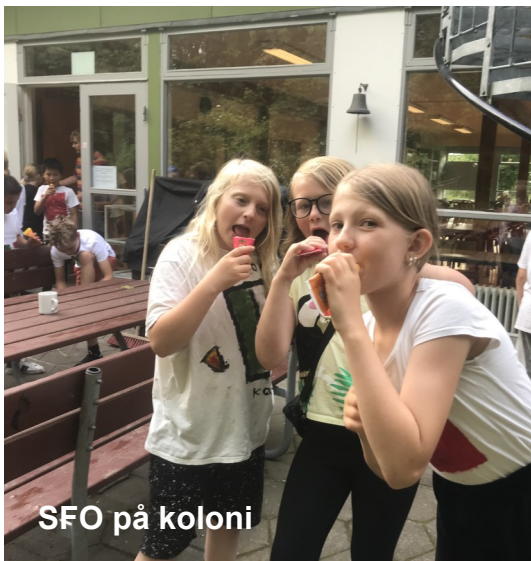
SFO på koloni