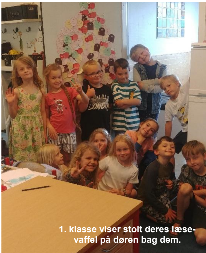
1. klasse viser stolt deres læse- vaffel på døren bag dem.

Landsbyskolen, Engvej 135 2300 København S Tlf: 32598631 SFO Tlf: 21406720 www.landsbyskolen.dk kontor@landsbyskolen.dk