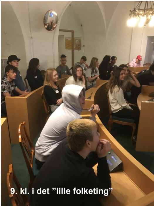
9. kl. i det "lille folketing"

8. og 9. klasse deltog i januar 2019 i undervisningsforløbet "Skolevalg 2019", som blev afsluttet med, at eleverne den 31. januar