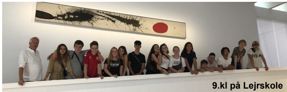
9.kl på Lejrskole