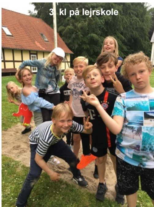
3. kl på Lejrskole

Loven om gratis skoletandpleje gælder også for privatskoler. Skolen indsender i september en liste over eleverne til de respektive kommuner, som så i løbet af året indkalder eleverne til tandeftersyn.