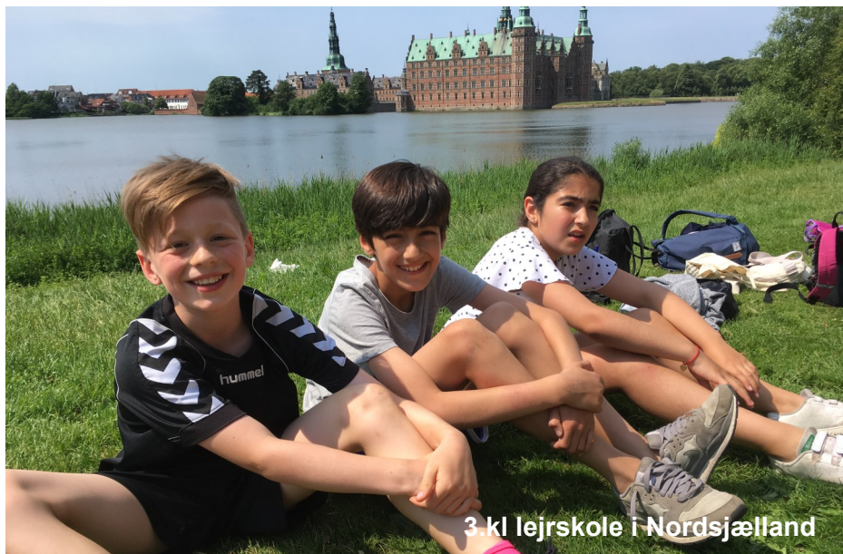
3.kl lejrskole i Nordsjælland

Loven om gratis skoletandpleje gælder også for privatskoler. Skolen indsender i september en liste over eleverne til de respektive kommuner, som så i løbet af året indkalder eleverne til tandeftersyn.