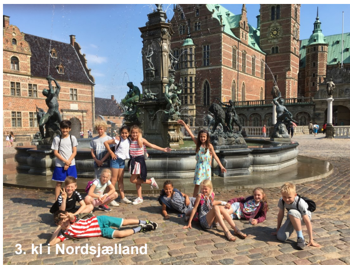
3. kl i Nordsjælland