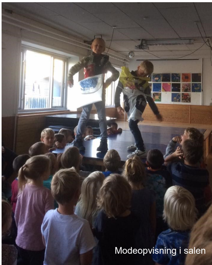
Modeopvisning i salen

I tilrettelæggelsen af undervisningen tager vi udgangspunkt i den enkelte elev/ klasse, så alle elever kan få mulighed for at udnytte deres evner. Vi benytter et samspil mellem klasse- og individuel undervisning. Dette indebærer, at elever i samme klasse ikke nødvendigvis altid arbejder med det samme materiale.