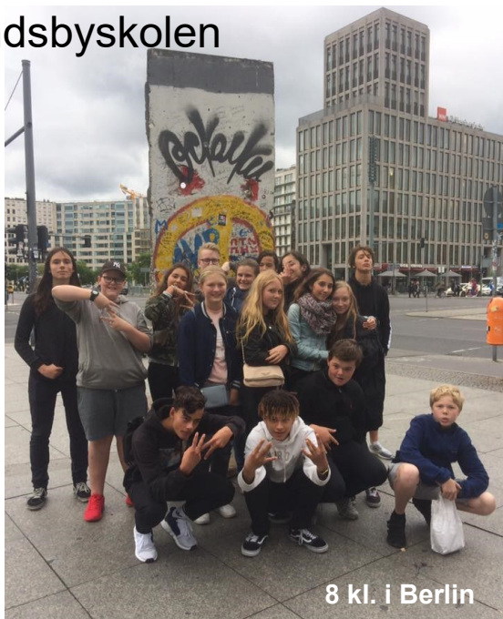
8 kl. i Berlin

forløb på skansen ved Dybbøl, var på Sønderborg slot og legede i vandrehjemmets lange gange. Vores 7. klasse har været en tur i sommerhus i Gedesby hvor vi bl.a. tog en smuttur til Rostock i Tyskland. Traditionen tro har 8. klasse været i Berlin, hvor de så rigsdagsbyg-