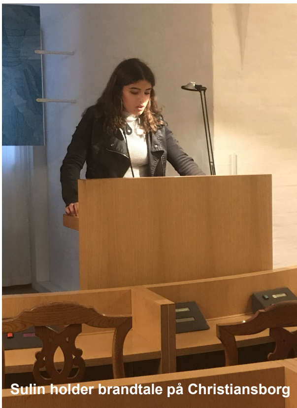
Sulin holder brandtale på Christiansborg