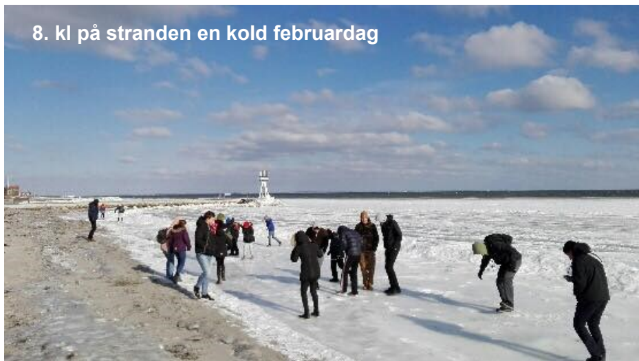
8. kl på stranden en kold februar dag

Der er mulighed for at søge et friplads-tilskud. Der er her kun tale om et mindre tilskud, som beregnes efter forældrenes årsopgørelse fra det foregående år. Tilskuddet er kun en nedbringelse af skolepenge samt SFO-betaling, og fordeles efter Fordelingssekretariatets fordelingsnøgle. Dokumentation og ansøgning skal foreligge før skolestart og ansøges hvert år.