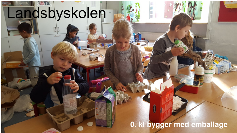
0. kl bygger med emballage

Landsbyskolen er en mindre, privatejet friskole med ca. 120 elever og 11 lærere. Skolen blev grundlagt af Martha Bak i 1974 og blev i 1988 overdraget til Stig Jørgensen.