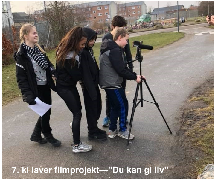
7. kl laver filmprojekt—"Du kan gi liv"